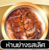
หันย่างรสเลิศ