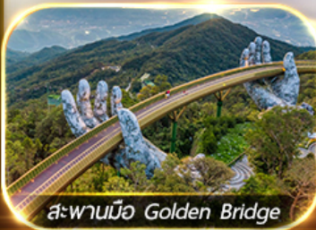
สะพานมือ Golden Bridge