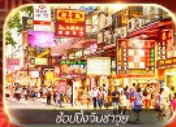
ช้อปปิ้งจิมซาจี้