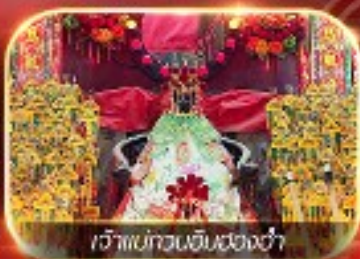
เจ้าแม่ทวนอิมสองอ่า