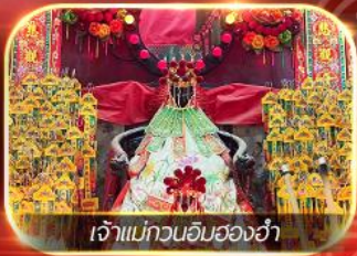
เจ้าแม่กวนอิมสองห้า