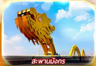
สะพานมังกร