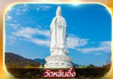
วัดหลินอึ้ง