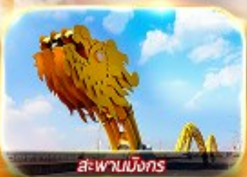
สะพานมังกร