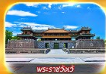
พระราชวังเว้