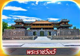
พระราชวังเว้