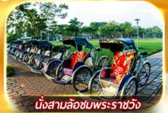
นั่งสามล้อชมพระราชวัง

สัมผัสความสวยงามหมู่บ้านสไตล์ฝรั่งเศสที่บานาวิลล่า วัดเทียนมู่ พระราชวังเว้ สัมผัสเมืองโบราณฮอยอัน ล่องเรือกระดิง