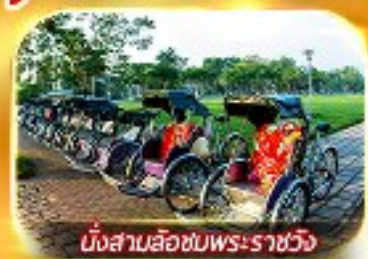
นั่งสามล้อชมพระราชวัง

สัมผัสความสวยงามหมู่บ้านสไตลฝรั่งเศสที่บานาฮิลล์ วัดเทียนมู่ พระราชวังเว้ สัมผัสเมืองโบราณฮอยอัน ล่องเรือกระดิง