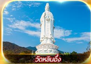
วัดหลินอึ้ง