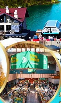
ตลาดกรีนบาร์ชา