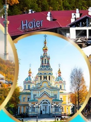
โบสถ์เซนคอฟ