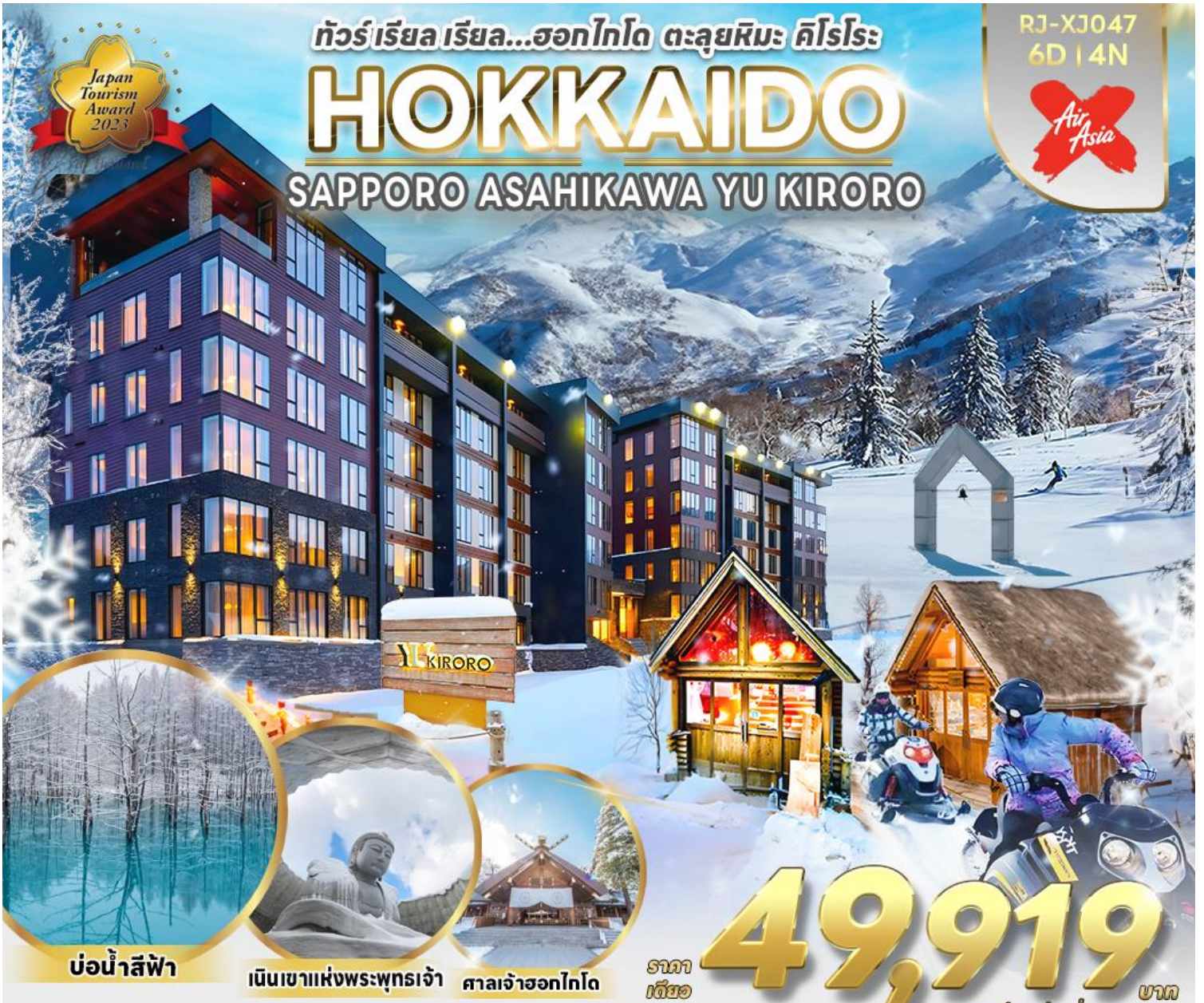
บ่อน้ำสีฟ้า