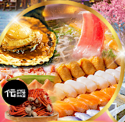
บุฟเฟ่ต์ซาปู + ซิวัด อาหาร มากกว่า 50 เมนู