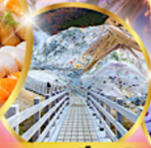
หุบเขานรกจิกุตาบิ