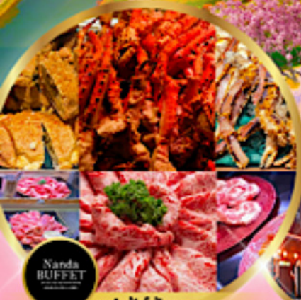
บุฟเฟ่ต์นันทะ ขนาด 3 ชนิด+ ซึฟู้ด + วากิวA5