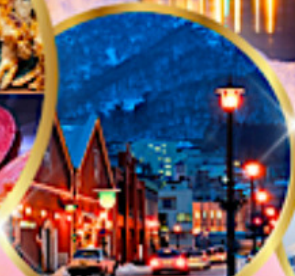
โถงดังฮังแดง