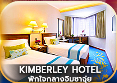
KIMBERLEY HOTEL พักใจกลางจิมซาจุ่ย