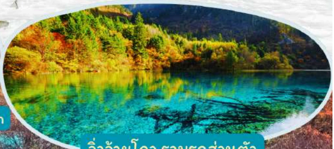
จิวจ้ายโกว รวมรถส่วนตัว