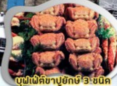
บุฟเฟ่ต์ขาปูยักษ์ 3 ชนิด