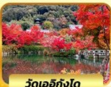
วัดเออิทังโด