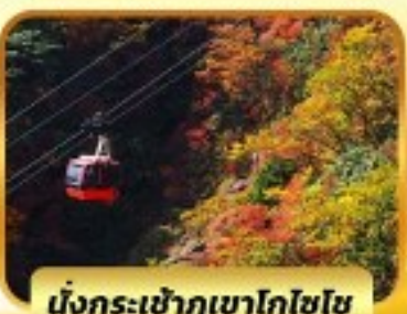
นั่งกระเช้าภูเขาโทโซไซ