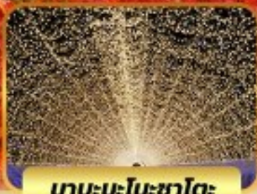
บาระนะโนะซาโตะ