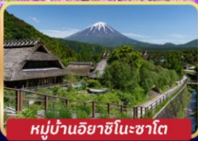
หมู่บ้านอิยาชิโนะซาโต