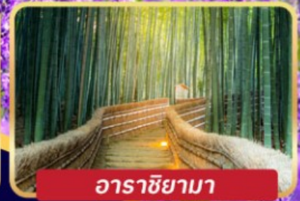
อาราชิยามา