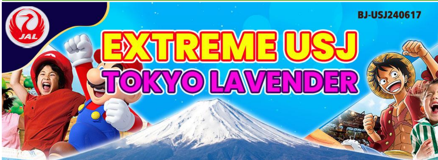
สัมผัสนั่งชินกันเซน