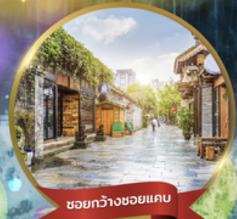
ชอยกว้างชอยแคบ