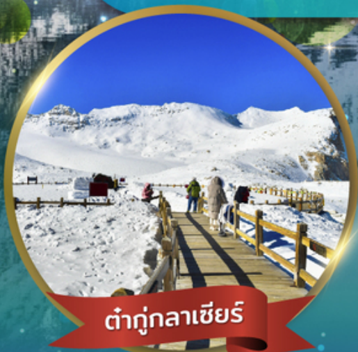
ต้ากู่กลาเซียร์