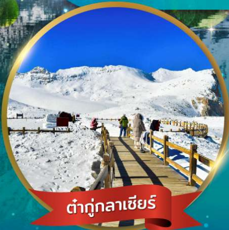
ต่ากู่กลาเซียร์