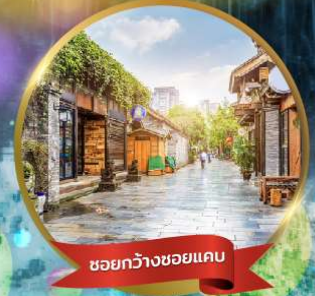
ชอยกว้างชอยแคบ