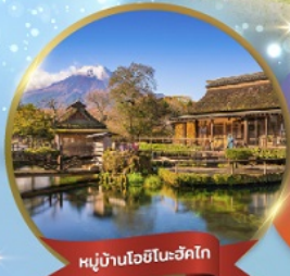
หมู่บ้านโอชิโนะซึกิโก