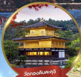
วัดทองคินคะคุจิ