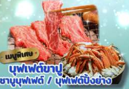
เมนูพิเศษ บุฟเฟ่ต์ข้าว ซาซิมิบุฟเฟ่ต์ / บุฟเฟ่ต์บิงชัง

ราคารวมทิปไกด์แล้ว พักออนเซ็น 1 คืน พักรีสอร์ท 3 คืน