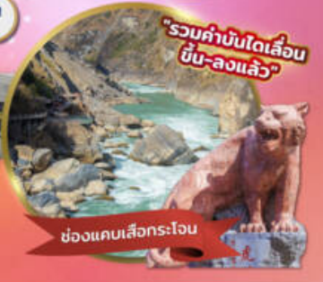
"รวมค่าบัตรเดินขึ้น-ลงแล้ว"