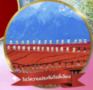
โชว์ความประทับใจลี่เจียง