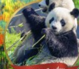
หิมะแพนด้ายิวจิว