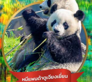
หมีแพนด้ายักษ์เจียงเยียน