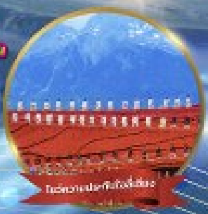
วัดลามะของจ้านหลิน