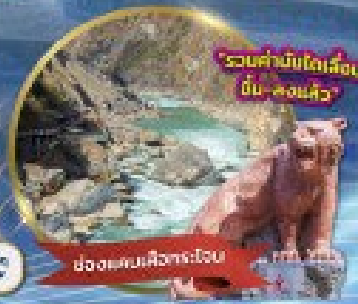
ช่องแคบเสิ่งกระโงน