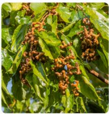
โบราณของชาวเกาหลีอีกด้วย