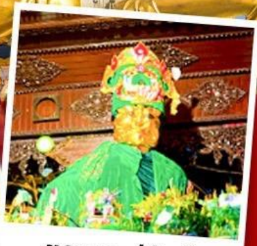
ขอพรแม่ยักยี