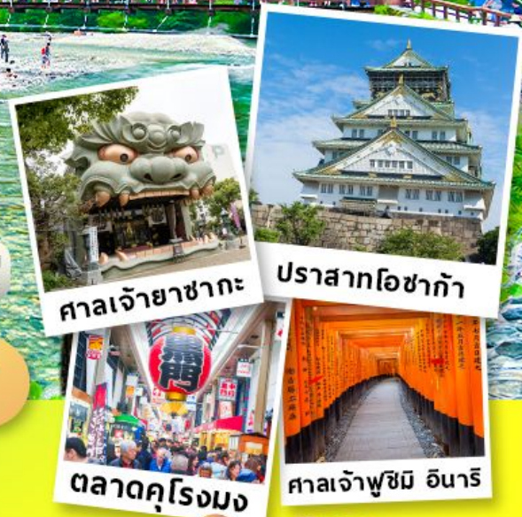
ศาลเจ้ายาซากะ ปราสาทโอซาก้า ตลาดคุโรมง ศาลเจ้าฟูชิมิ อินาริ