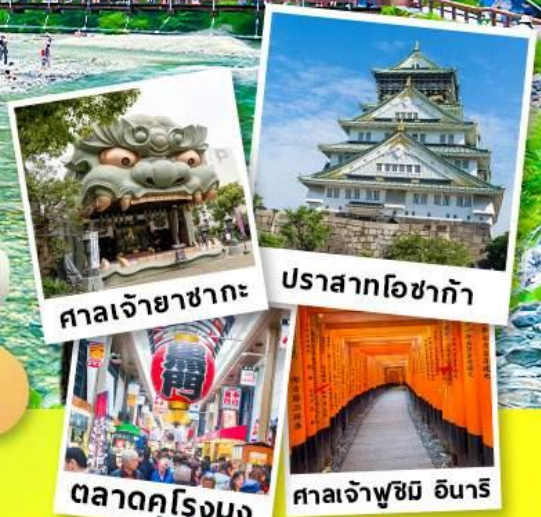
ศาลเจ้ายาซากะ

✓ 🏠 ที่พักในเมือง 1 คืน ใกล้ย่านช้อปปิ้ง