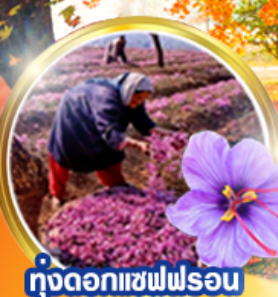
ทุ่งดอกแซฟฟรอน