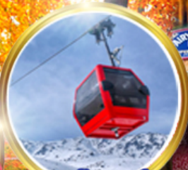
กระเช้ากุลมาร์ค ชมวิวสุดอลังการ