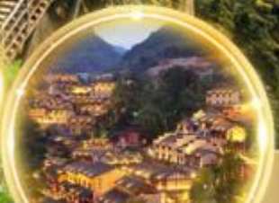
ดื่มด่ำบรรยากาศสุดพิเศษ พร้อมพิทักษ์ในหุบเขา