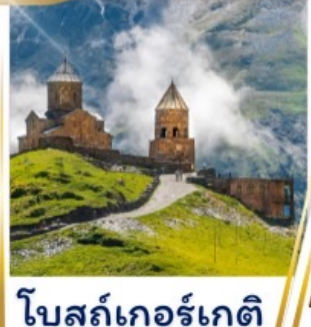
โบสถ์เกอร์เกติ