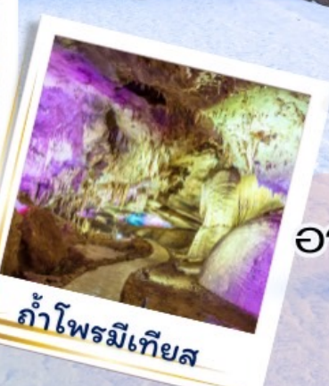
ถ้ำไฟรมีเทียส