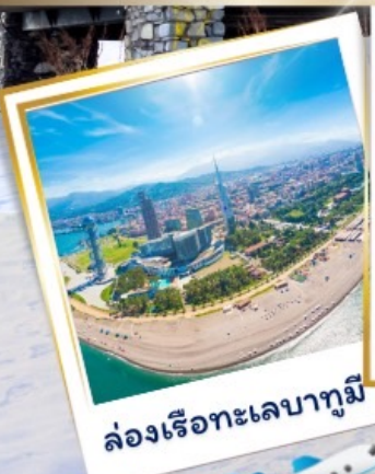
ล่องเรือทะเลบากูมี

อาหารครบทุกมื้อไม่มีมืออึสะระ จัดเต็มไปด้วยสถานที่ท่องเที่ยว! พักโรงแรม 4 ดาวแท้แน่นอน!