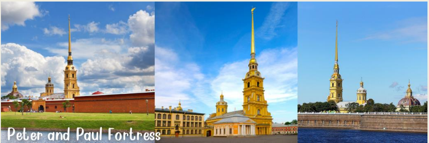
Peter and Paul Fortress