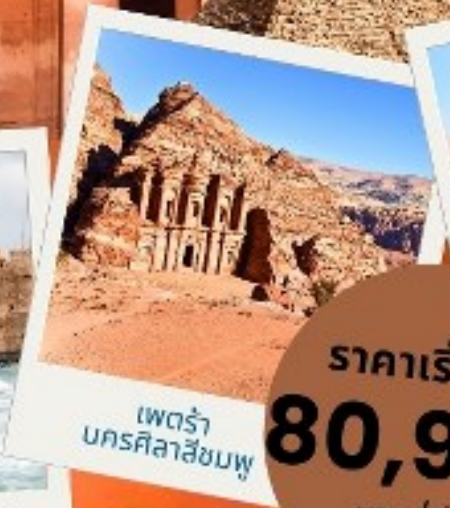
เพตรา นครศิลาสีชมพู