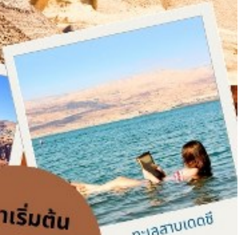
ทะเลสาบเดดซี