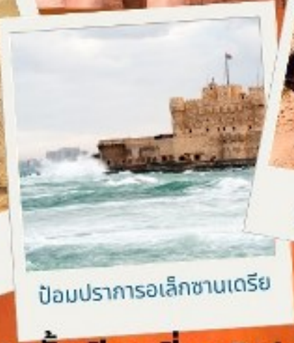
ป้อมปราการอเล็กซานเดรีย