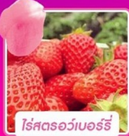
โรสตรอว์เบอร์รี่

เริ่มเดินทาง 01 มี.ค.-30 มิ.ย. 2567 บินโดย Jeju Air JEJUair น้ำหนักกระเป๋า 20 Kg.