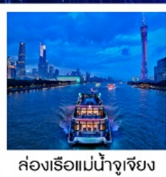
ล่องเรือแม่น้ำจูเจียง

ล่องเรือแม่น้ำจูเจียง / ช้อปปิ้งถนนปักกิ่ง / ช้อปปิ้งถนนซิงเซี่ยจิว / วัดโหลหนัน / ศาลเจ้าตระกูลเฉิน / ถนนคนเดินหย่งซิงฟาง