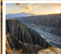
แกรนด์แคนยอนตูซานจื่อ