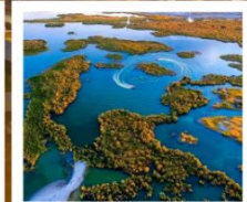
ทะเลสาบอูหลุนกู่

ผ่านทางด่วนทะเลทราย S21 / ทะเลสาบอูหลุนกู่ / ปู่อ๋อจิน / เซาโปซา / ทุ่งหญ้าอาเหอถังโก่ตี้ / หมู่บ้านเหมอู่ซุน / คานาสีอ / ทะเลสาบมังกรหลับ / ทะเลสาบเทวดา จุดชมวิวกานาสีอ / ศาลาชมปลา / ล่องเรือทะเลสาบคานาสีอ / หาดห้าสี / เมืองปีศาจ / เมืองคาลามาอี / คาลามาอี / แกรนด์แคนยอนตูซานจื่อ / ตลาดต้าปาจา