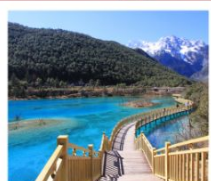
ปี่สุ่ยเหอ