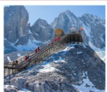
ภูเขาหิมะมังกรหยก

เมืองโบราณด้าหลี่ / เจดีย์สามองค์ / โถงแรกแม่น้ำแยงซี / เมืองโบราณแชงกรี่ล่า วัดลามะซงจันหลิง / ซ่องแคบสี่กักระโดด / เมืองโบราณชู่เหอ / ภูเขาหิมะมังกรหยก หุบเขาพระจันทร์สีน้ำเงิน / โข่วจางอวี๋หมว / สระน้ำมังกรดำ - เมืองโบราณลี่เจียง เขาซีซาน / ประตุมังกร / วัดหยวนทง / สวนด้ากวนโหลว