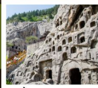
ถ้ำหินหลงเหมิน