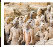
สุสานจีนซี

วัดเส้าหลิน / ป่าเจดีย์ / โชว์การแสดงวิทยายุทธเส้าหลิน / อุทยานหยุนโกซาน ศาลเจ้ากวนอู / ถ้ำหินหลงเหมิน / สุสานทหารจีนซี / ถนนคนเดินวัฒนธรรมต้าถิง โชว์ราชวงศ์ถัง / กำแพงเมืองโบราณซีอาน / วัดลามะ / ตลาดมุสลิม