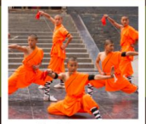
โชว์เส้าหลิน

PERIOD 1 : 9 - 14 สิงหาคม | PERIOD 2 : 18 - 23 ตุลาคม 2567