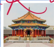
พระราชวังเสียนหยางกุ่กง