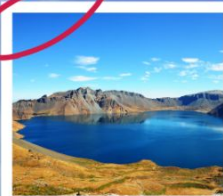
ดางโป้ซาน