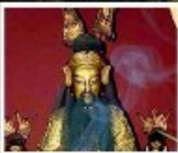
เอียงบู๊ซิว