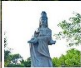
เจ้าแม่ทับทิม