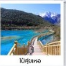
โป๋ซุ่ยเหอ

นั่งรถไฟความเร็วสูง จาก ลี่เจียง - คุณหมิง