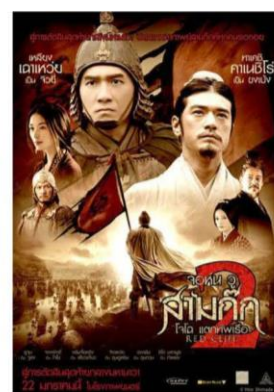
ภาพยนตร์และซีรีส์ชื่อดัง ถ่ายทำที่ Hengdian World Studios