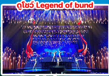
ดูโชว์ Legend of bund

หังโจว - เหวงเตี้ยน - หุบเขาเทวดา วังเซียนกู่ พีชิตยอดเขาหลินซาน 5 วัน 3 คืน