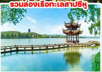
รวมล่องเรือทะเลสาบซีหู