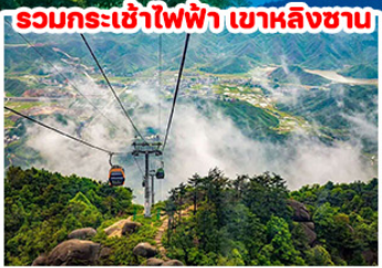
รวมกระเช้าไฟฟ้า เขาหลินซาน