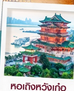
หอถึงหวงเก๋อ