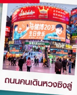
ถนนคนเดินหวงซิงสู่