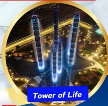
Tower of Life

อุทยานภูเขาสี่ฤดู หุบเขาของเฉียวโกว (รวมรถอุทยาน) อุทยานพีพีเฟิงโกว(รวมรถอุทยาน + รถแบ็ตเตอร์รี่ ) ภูเขาหิมะการ์เซียต้ากู่ปิงชว่น (รวมรถอุทยาน+กระเช้า) - วัดต้าฉือ ต้นคนเดินชุนซีลู่ - ชมแสงสี The Tower of Lifeที่ลานห้าง SKP ถนนคนเดินชอยกวางแคม - POP MART