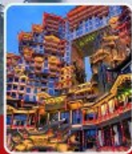
ตึก 72 ชั้น

อุทยานจางเจียเจีย เขาคิยงจื่อซาน สะพานหนึ่งโบริดจ์ ทะเลสาบเป่าเฟิงหู ตึกมหัศจรรย์ 72 ชั้น เมืองโบราณฟูหลงเจิน เมืองโบราณฟ่งหวง ล่องเรือแม่น้ำถั่วเจียง สะพานสายรุ้ง ซ้อปี้ง ถนนคนเดินหลงซิงลู่