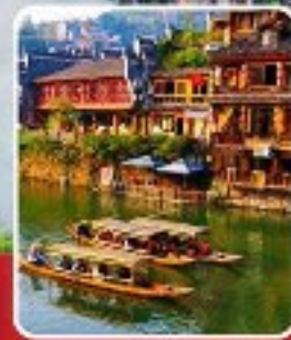
เมืองโบราณฟ่งหวง

เที่ยวฟิน 2 เมืองโบราณ พิชิตเขาวงกต แพนดอร่าของเมืองจีน