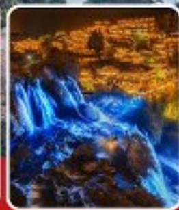
ฟูหลงเจิน