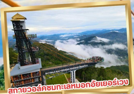
สกายวอล์คชมทะเลหมอกอัยเยอร์เวง

ร่วมโครงการ ลดหย่อนภาษี ลดสูงสุด 15,000.-