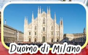
Duomo di Milano