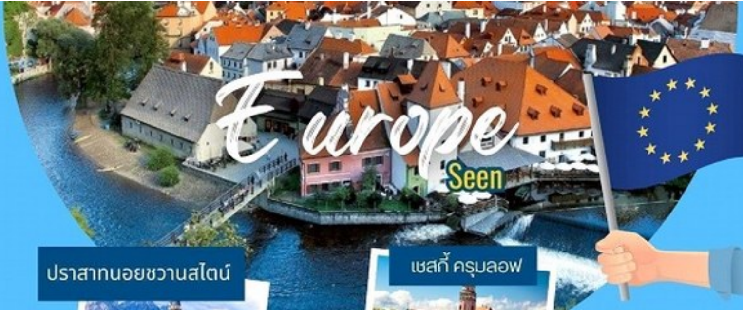
ปราสาทนอยชวานสไตน์

ไปเที่ยวกัน ... นะ กรุ๊ปเหมา เป็นหมู่คณะ หรือจอยทัวร์ ท่องเที่ยวไปกับทัวร์ไม่เหนื่อยไม่หลงทาง คิดจะเที่ยว คิดถึงทัวร์คุณชาย