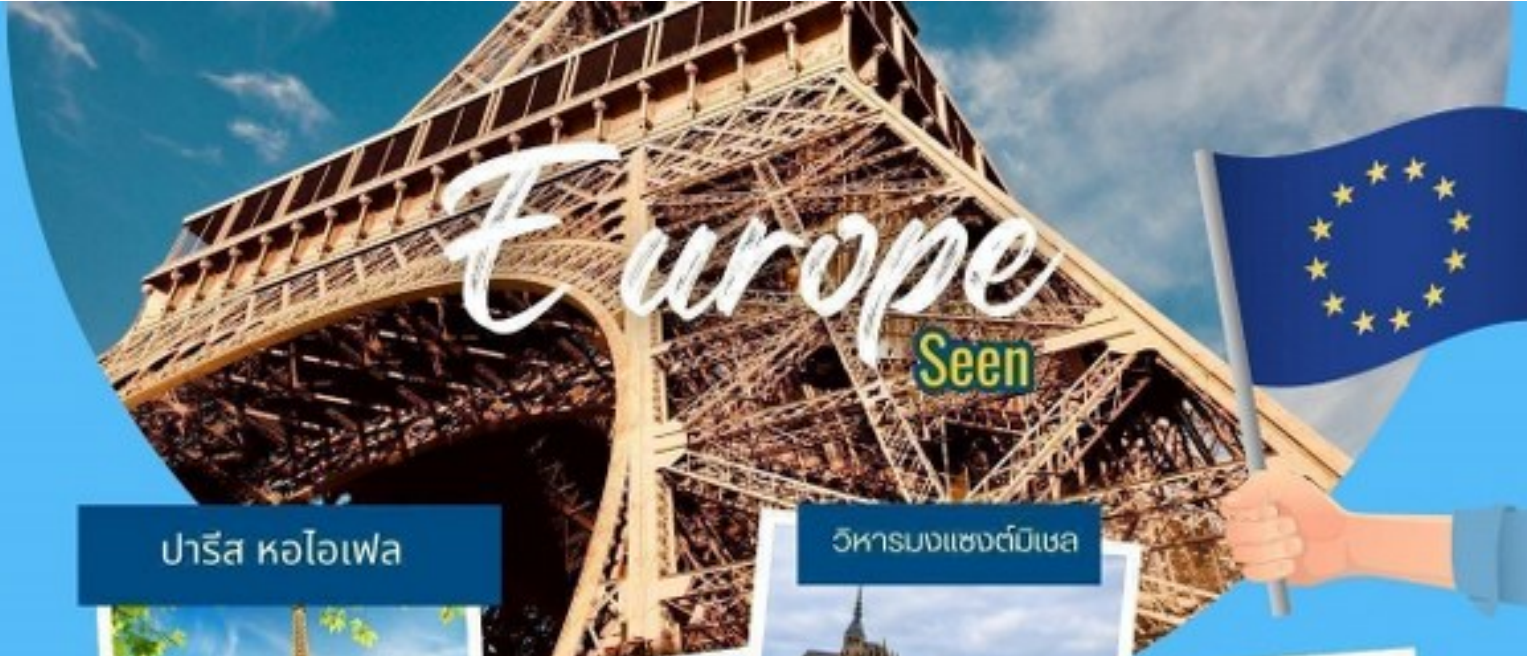
ปารีส หอไอเฟล

ไปเที่ยวกัน ... นะ กรุ๊ปเหมา เป็นหมู่คณะ หรือจอยทัวร์ ท่องเที่ยวไปกับทัวร์ไม่เหนื่อยไม่หลงทาง คิดจะเที่ยว คิดถึงทัวร์คุณชาย