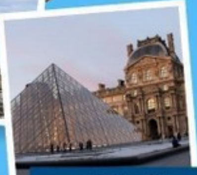
ลูฟว์ ปารีส