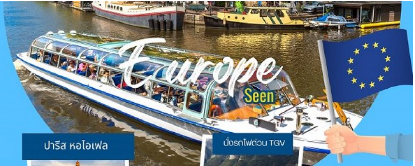
ปารีส หอไอเฟล

ไปเที่ยวกัน ... นะ กรุ๊ปเหมา เป็นหมู่คณะ หรือจอยทัวร์ ท่องเที่ยวไปกับทัวร์ไม่เหนื่อยไม่หลงทาง คิดจะเที่ยว คิดถึงทัวร์คูนชาย