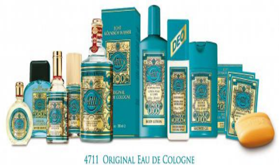
4711 ORIGINAL EAU DE COLOGNE