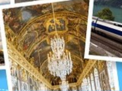
พระราชวังแวร์ซายส์