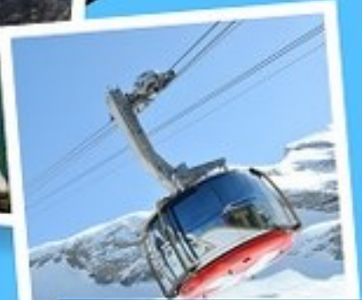
ยอดเขาทิตลิส

ฝรั่งเศส สวิตส เนเธอร์แลนด์ เยอรมนี 12 วัน 9 คืน