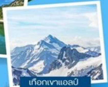
เทือกเขาแอลป์