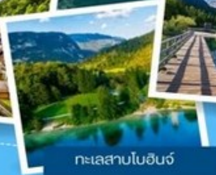
ทะเลสาบโบฮีเมีย