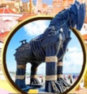
น้ำไม้เมืองทรอย