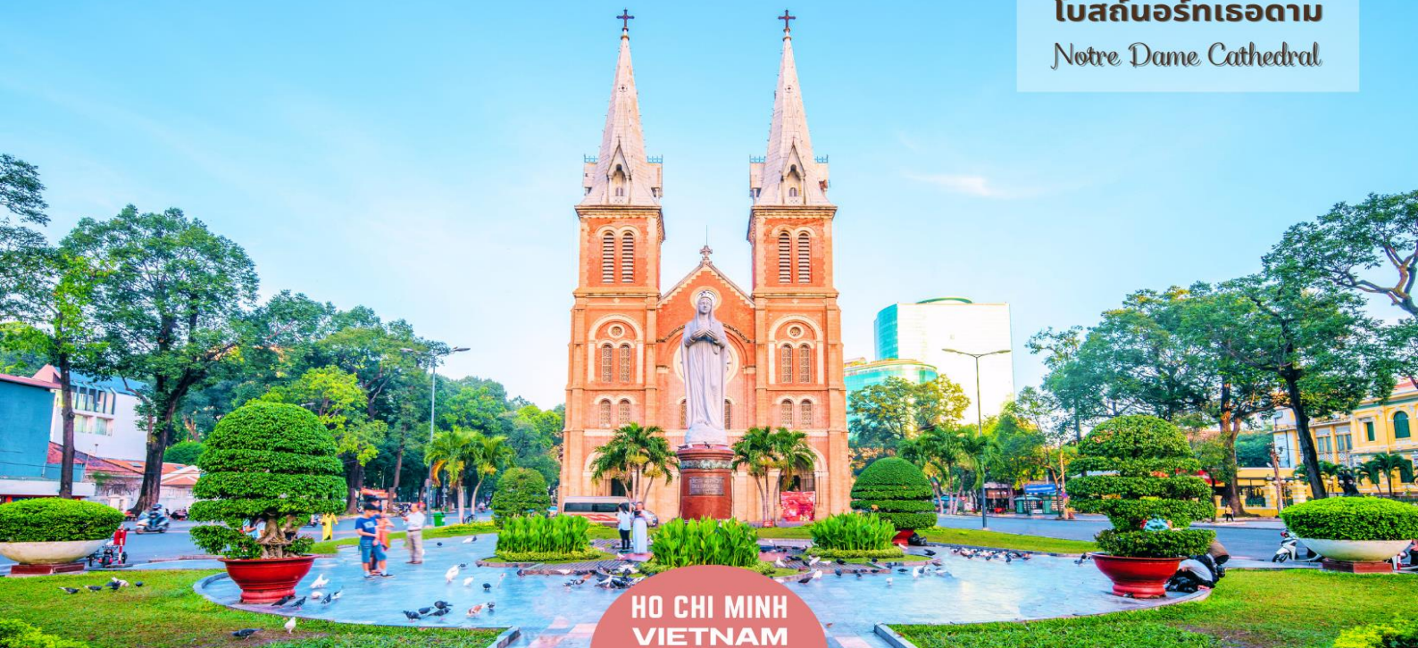
HO CHI MINH VIETNAM