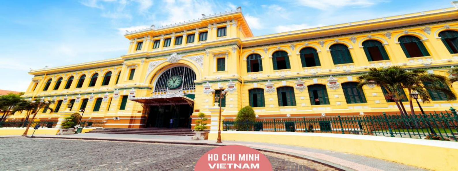
HO CHI MINH VIETNAM

นำท่านถ่ายรูป มหาวิหารนอร์ทเทอร์ดาม เป็นอัญมณีทางสถาปัตยกรรมอันงดงามที่มีความสำคัญทางประวัติศาสตร์และวัฒนธรรม วิหารแห่งนี้สร้างขึ้นในยุคอาณานิคมฝรั่งเศส และเป็นสัญลักษณ์ของมรดกอันมั่งคั่งและความศรัทธาอันยาวนานของชาวเมืองไซงอน วัสดุที่ใช้ก่อสร้างล้วนนำเข้ามาจากฝรั่งเศส เป็นการผสมผสานอิทธิพลระหว่างยุโรปและเวียดนามอย่างลงตัว ความสมบูรณ์ของโครงสร้างเป็นข้อพิสูจน์ถึงคุณภาพของวัสดุเหล่านี้ รวมถึงอิฐสีแดงที่แข็งแรงในส่วนหน้าของอาคารซึ่งมีความวิจิตรสวยงาม และยอดแหลมที่สูงตระหง่าน ภายในวิหารยังได้รับการออกแบบให้รองรับผู้คนได้ประมาณ 1,200 คน