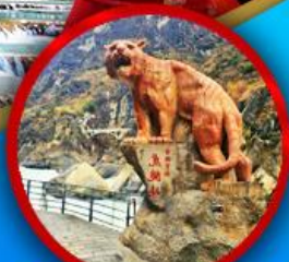
ช่องเขาเสือกระโจน