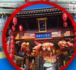
เมืองโบราณต้าลี่