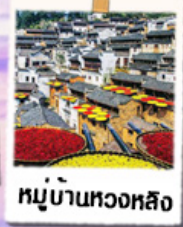
หมู่บ้านทงหลิง