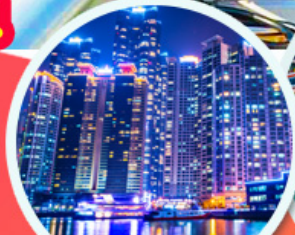
The Bay 101