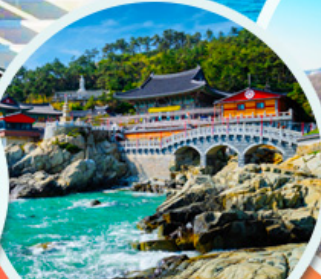
วัดแฮดง ยงกุงซา