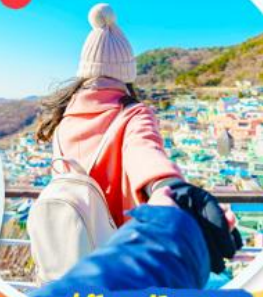
หมู่บ้านคัมซอน

สายการบินแอร์ปูซาน (BX) <ชั้นเครื่องสุวรรณภูมิ>