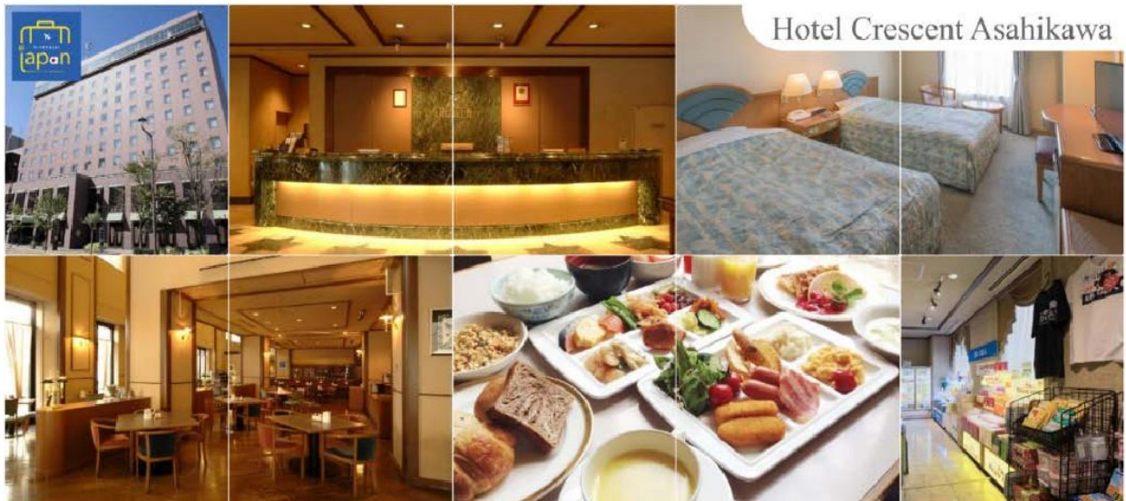
Hotel Crescent Asahikawa

คำ อีสระรับประทานอาหารค่ำตามอัธยาศัย ที่พัก HOTEL CRESCENT ASAHI KAWA หรือเทียบเท่า